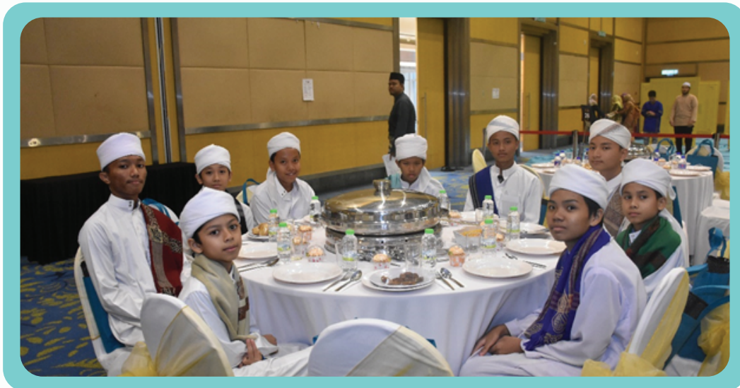
Jemputan MAM daripada pelajar-pelajar tahfiz