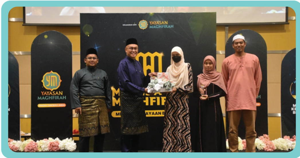
Anugerah pelajar terbaik kelas SAQ