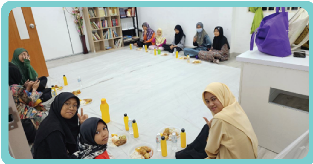
Majlis iftar kelas SAQ cawangan Anjung Budi