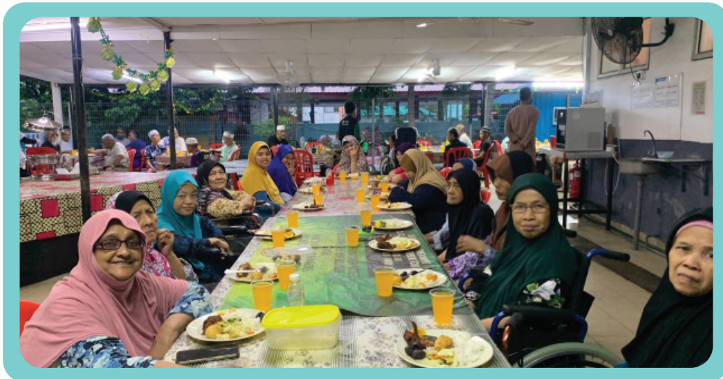
Program Tajaan Iftar di Pusat Jagaan Warga Emas Al-Fikrah