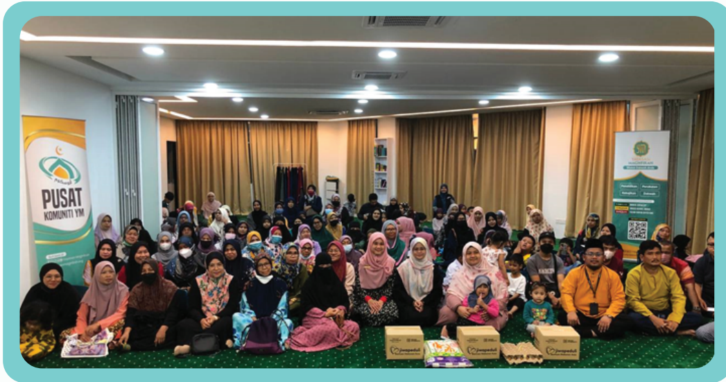
Penerima – penerima agihan bantuan barangan asas