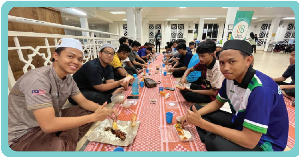
Program Tajaan Iftar di Politeknik Nilai