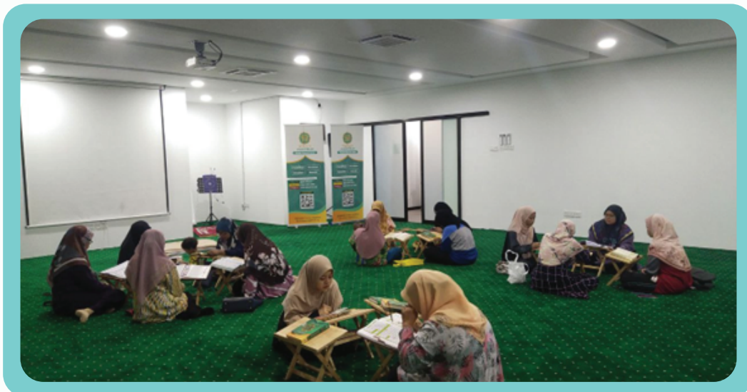
Program tadarus Al-Quran