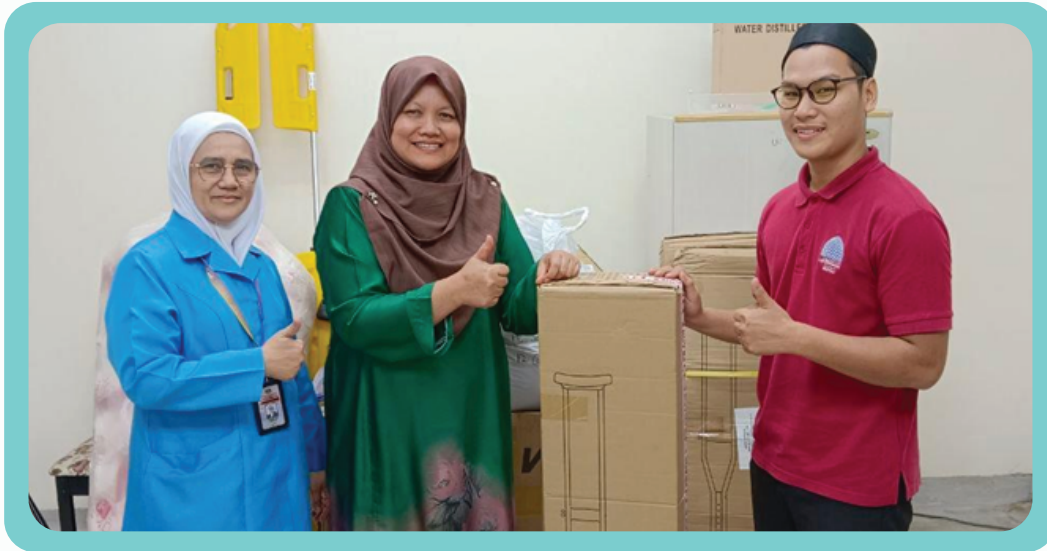
Serahan Bantuan Peralatan Perubatan kepada PLPP Bangi