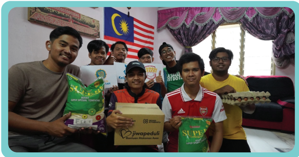
Ziarah dan Santuni Keluarga OKU 2