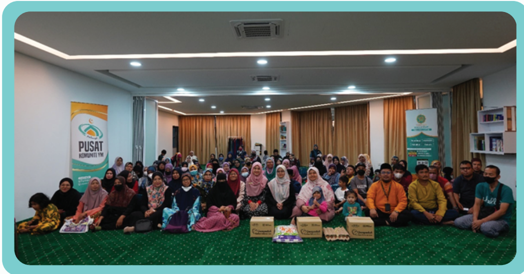
Program Foodbank Ramadan di PUSKOM YM