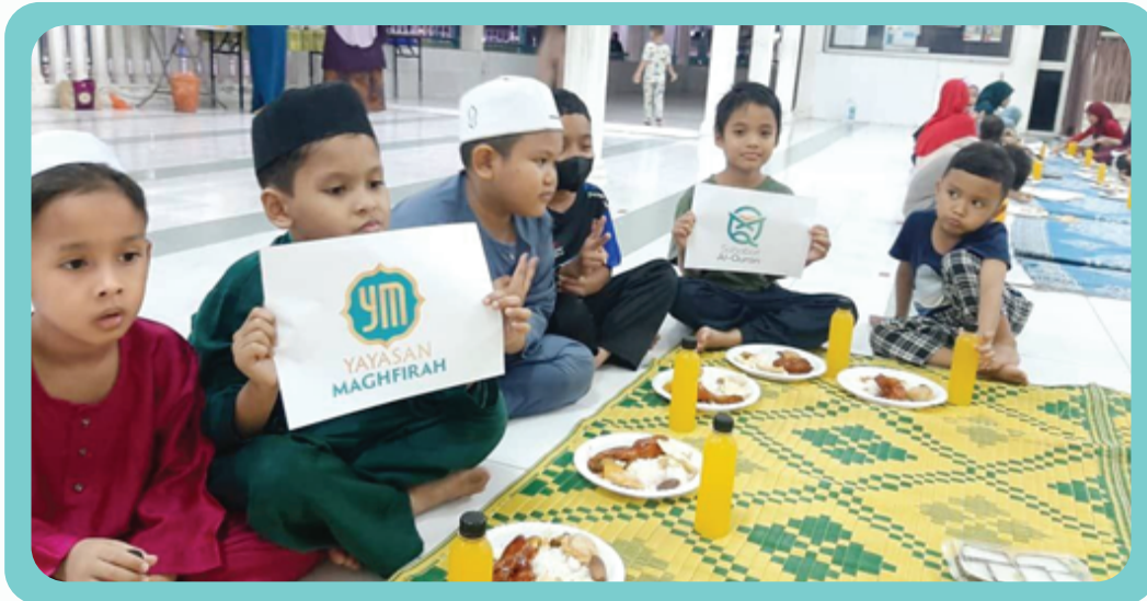
Majlis iftar kelas SAQ cawangan Seksyen 24