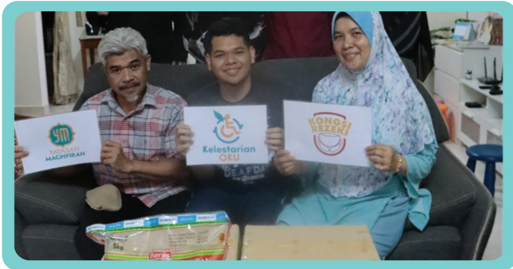
Ziarah dan Santuni Keluarga OKU 1