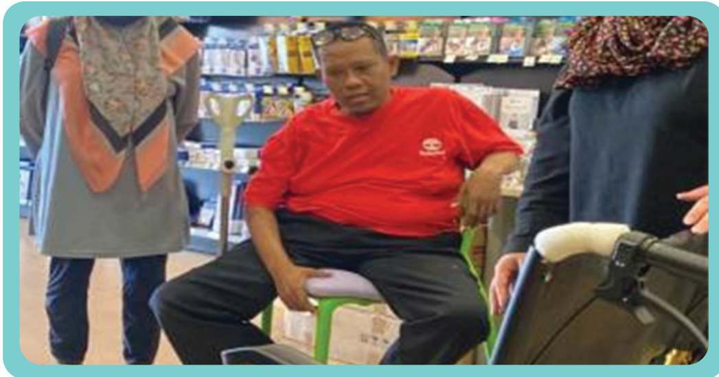
Serahan Bantuan Kerusi Roda kepada Pesakit Dialisis