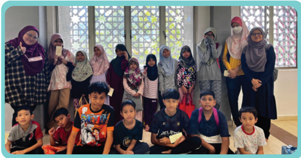
Pengagihan duit raya kepada para pelajar