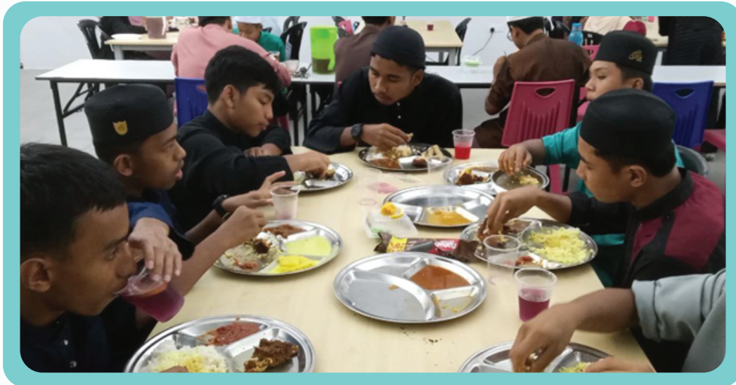
Program Tajaan Iftar Anak Yatim di Asrama Damai Kuang