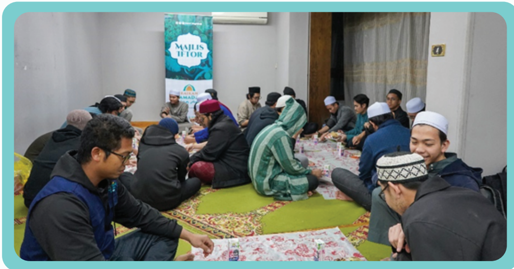
Program Tajaan Iftar di Darul Magfirah