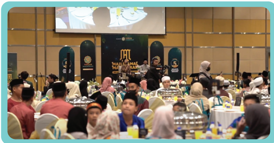
Majlis Amal Magfirah bersama anak-anak asnaf dan anak yatim di Dewan Seri Siantan Putrajaya