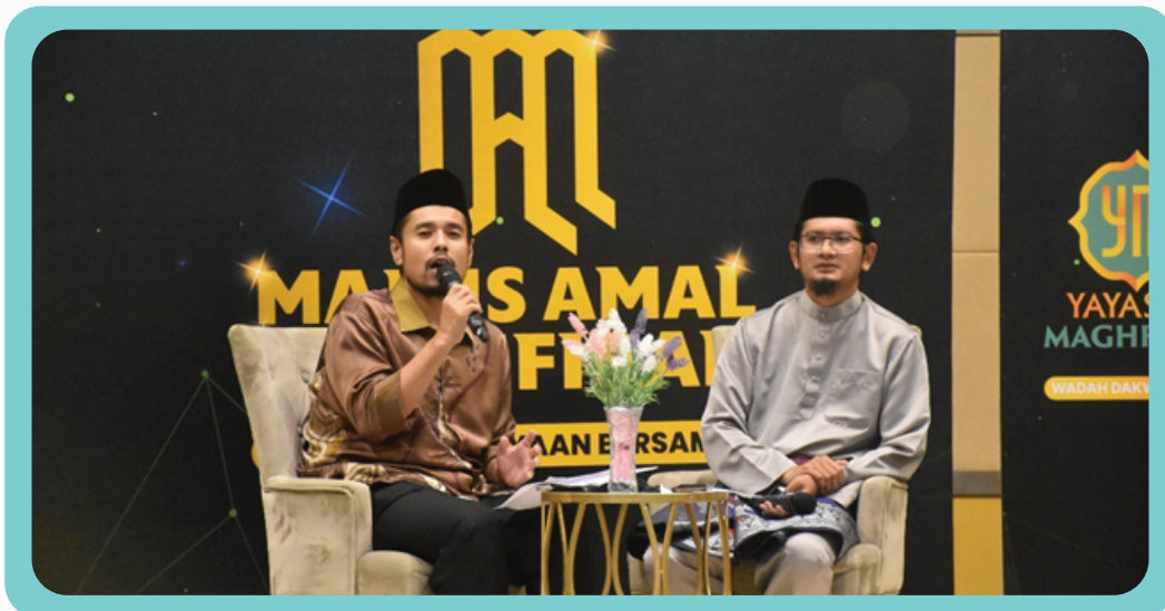
Pengisian secara santai oleh panelis