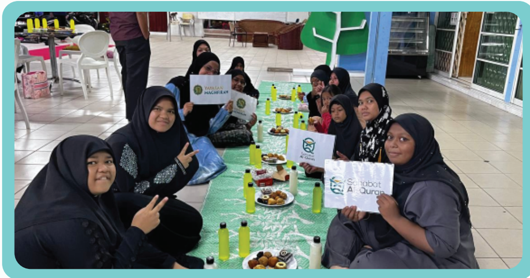
Program Tajaan Iftar melibatkan pelajar Sahabat Al-Quran YM