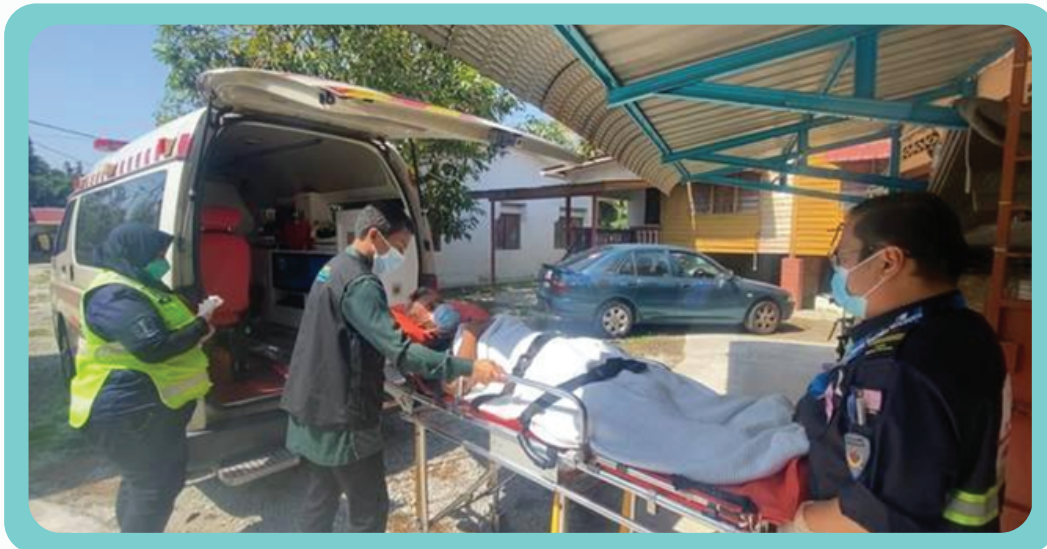
Bantuan Khidmat Ambulans kepada Pesakit OKU