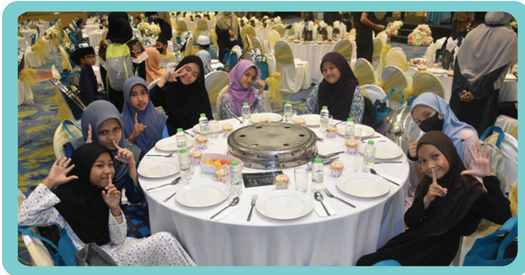
Jemputan MAM daripada anak anak SAQ