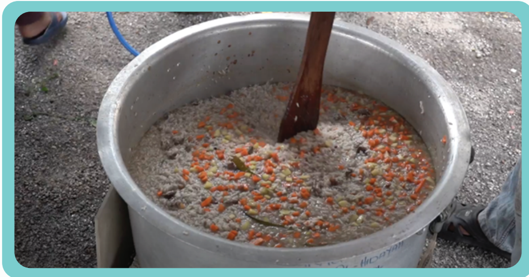
Program Rewang Bubur Lambuk bersama masyarakat komuniti Taman Putra Kajang