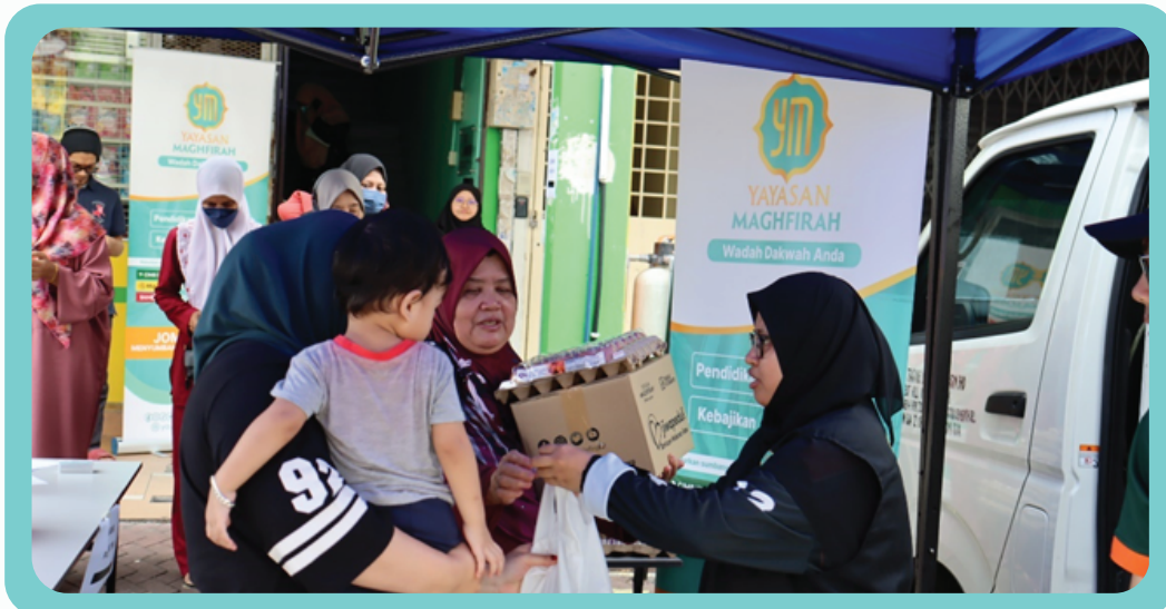
Program Foodbank Syawal di PUSKOM YM