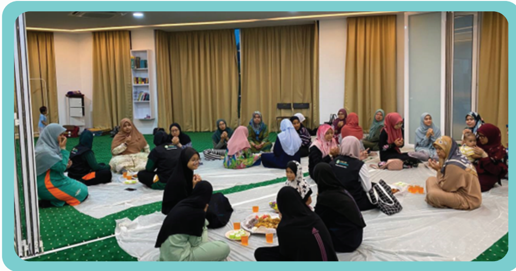
Program iftar mingguan