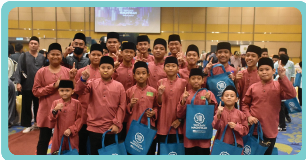
Jemputan MAM yang memeriahkan MAM