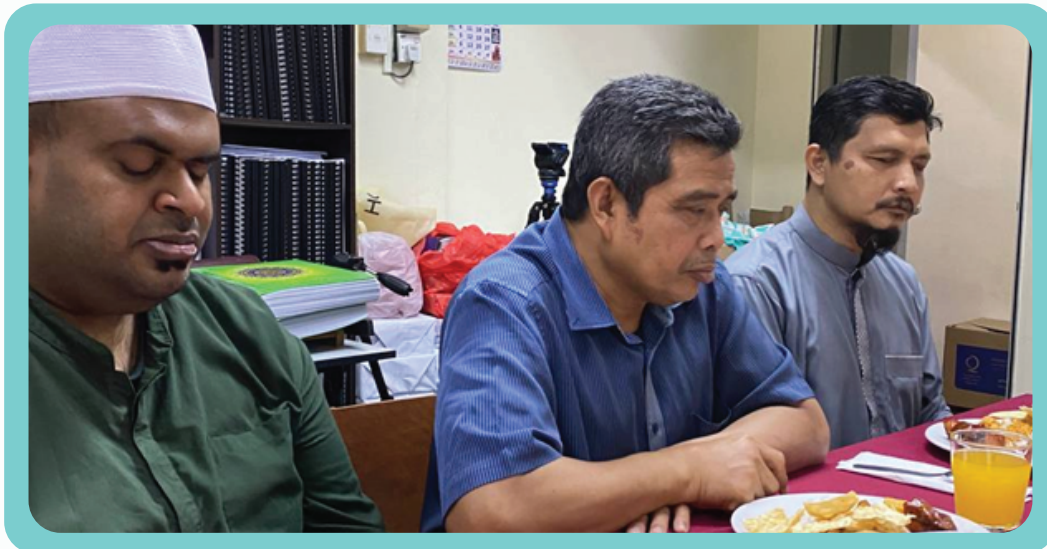
Program Tajaan Iftar kepada golongan OKU Penglihatan di PERTIS