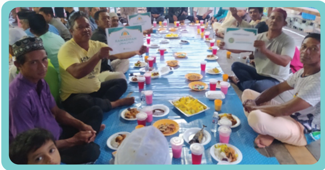
Program Tajaan Iftar di Pulau Sakar