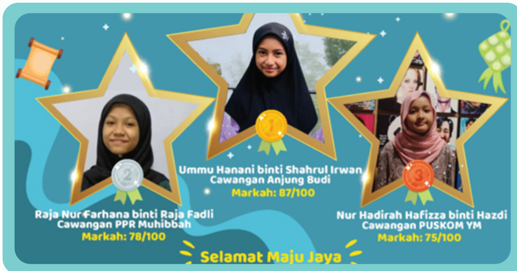
Antara pemenang kuiz ramadan SAQ