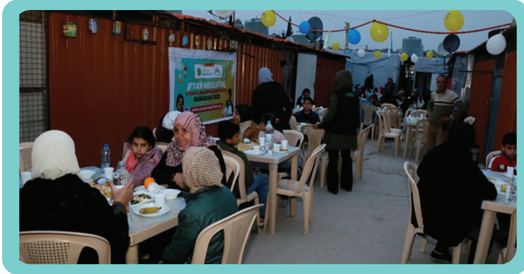
Program Tajaan Iftar di Kem Pelarian Syria, Aarsal, Lubnan