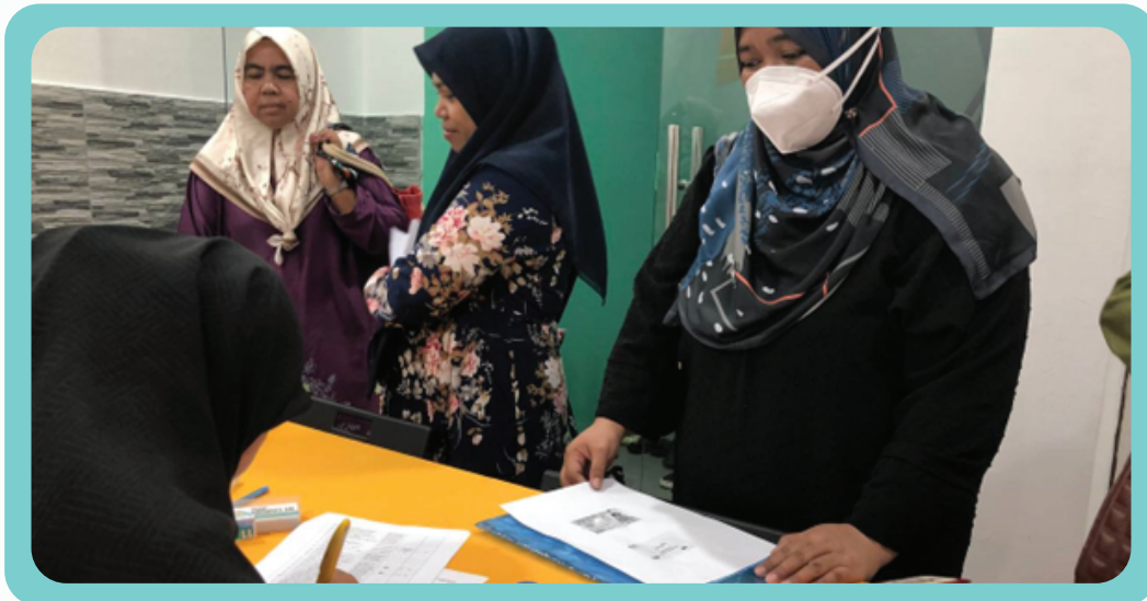
Proses semakan dokumen agihan barangan asas