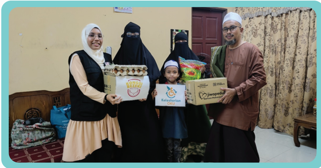
Ziarah dan Santuni Keluarga OKU 3