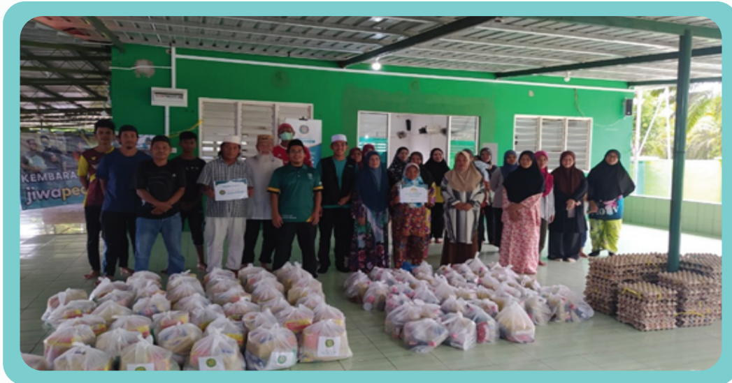
Ziarah dan Santuni Keluarga OKU 3