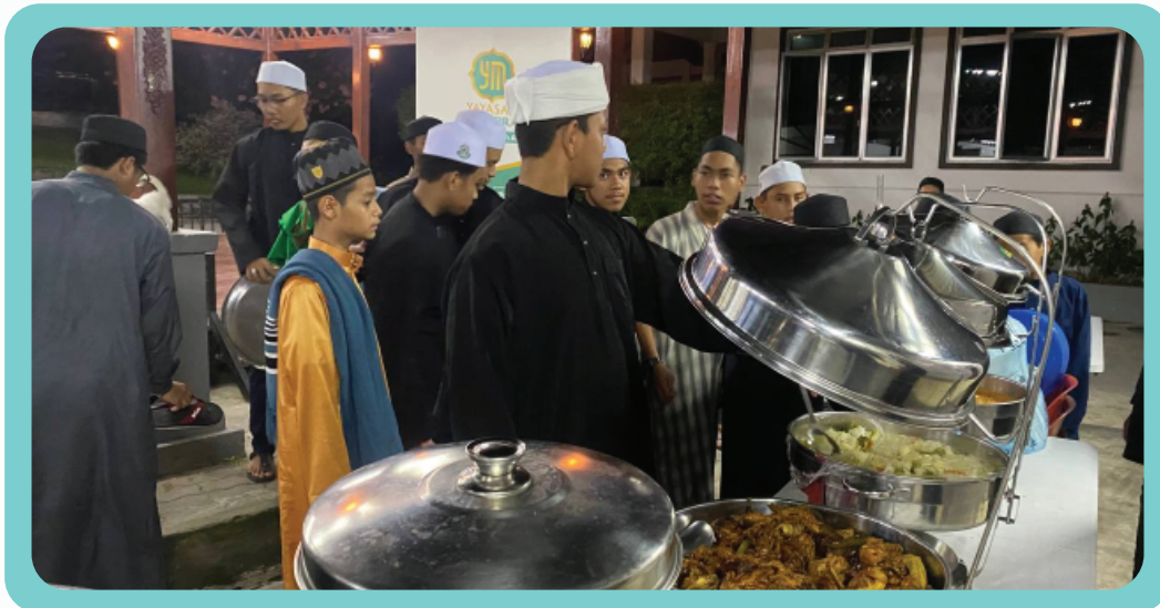
Program Tajaan Iftar di Madrasah Tahfiz Imam As-Shafie