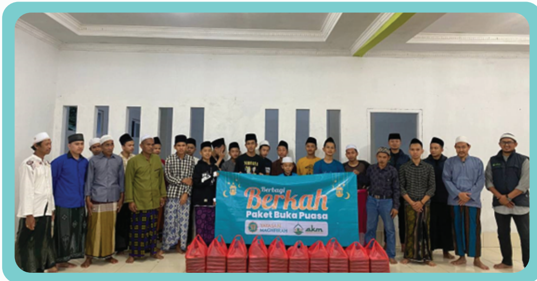
Program Tajaan Iftar di Kampung Pakopen, Indonesia