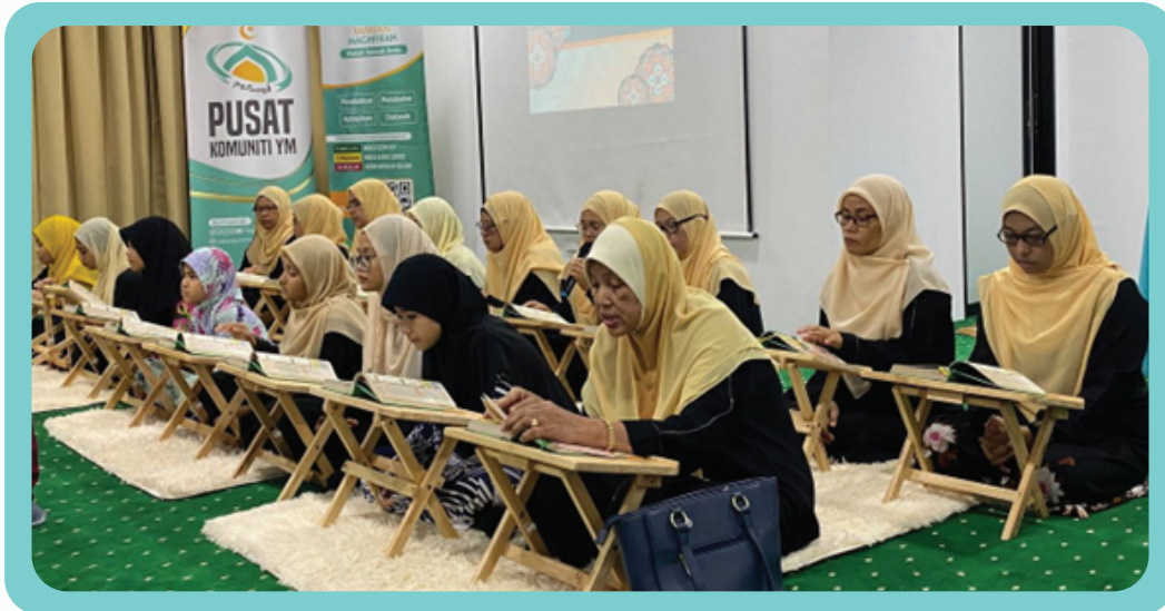
Program tadarus dan majlis khatam Al- Quran