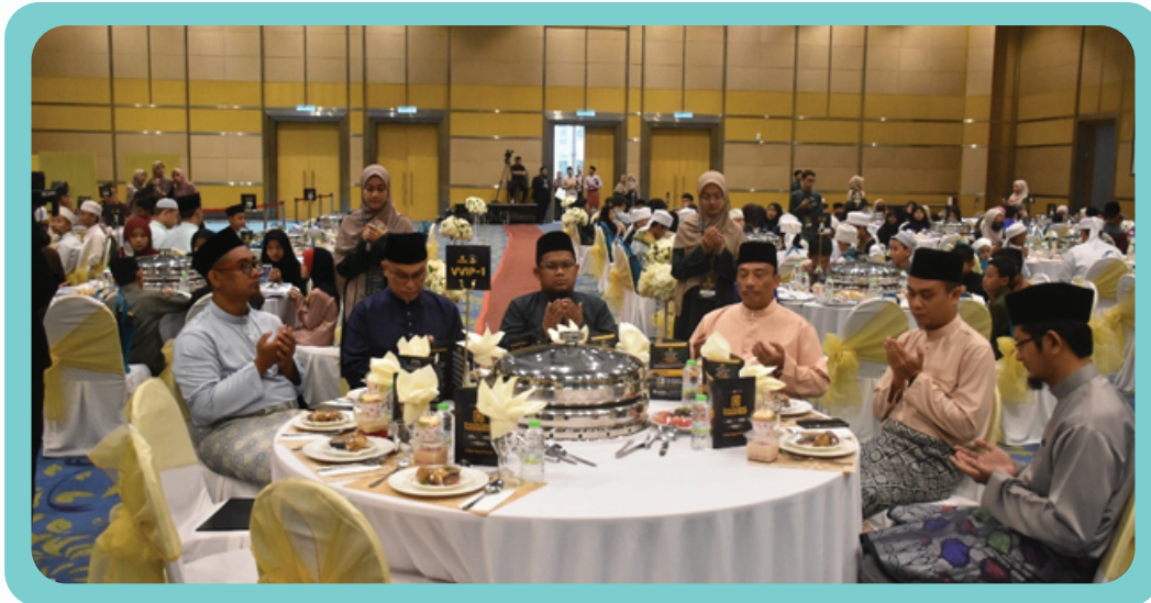
Jemputan MAM daripada syarikat koporat