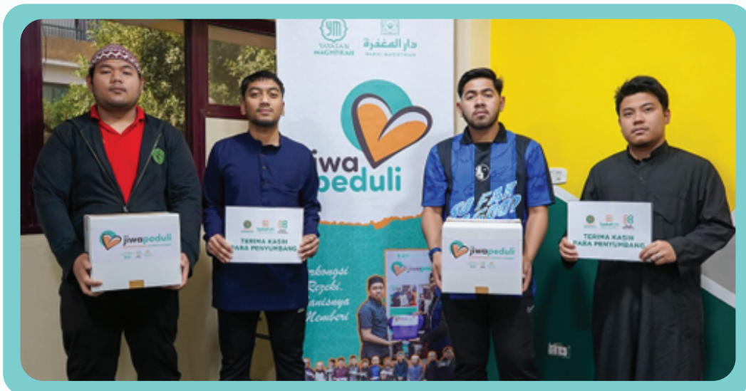
Ziarah dan Santuni Keluarga OKU 4