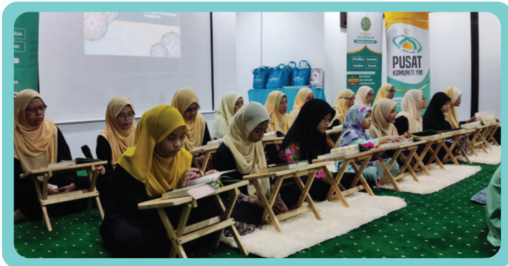
Majlis Khatam al-Quran dan iftar bersama masyarakat komuniti Taman Putra Kajang di PUSKOM YM